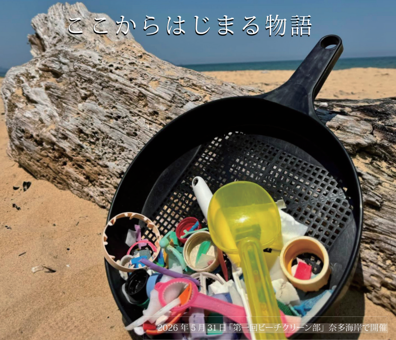
2026年5月31日「第一回ビーチクリーン部」奈多海岸で開催