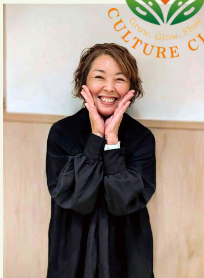
ILC カルチャー倶楽部